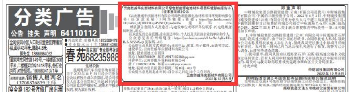
图 3-3 第二次报纸公示照片

还要注意到的是,有些儿童保健品剂量元素有限,添加糖却很多,保健品软糖的含糖量过高,并不符合少年儿童的生长需求,反而会增加龋齿、肥胖等健康风险,对孩子成长发育不利。花费更多,不仅没有效果,反而对孩子不利,这恐怕是许多家长没有想到的吧!事实上,有家长就发现,“买来一天只能吃两颗,因为口感好,孩子有时候偷吃了四颗甚至六颗。”其实,对于孩子来说,他们在意的并不是保健品软糖的维生素,而是那诱人的口味。 望子成龙是人之常情,可以理解。孩子是家庭的未来和希望,为孩子付出多一些,是再正常不过的。但客观、理性地选择产品,才会对孩子成长有益。盲目跟风,或者完全听信宣传广告,花费巨大代价,结果却对孩子健康构成风险,这不仅在交智商税,恐怕也是在自毁长城。