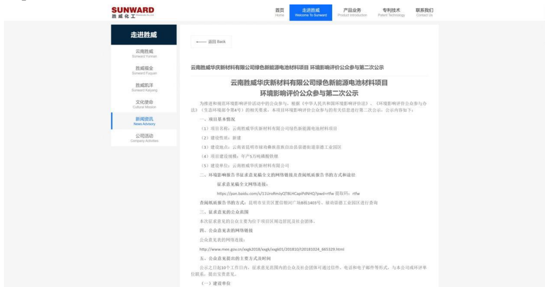
图 3-1 征求意见稿网络公示

征求意见稿公示在建设单位官网（ https://www.sunwardchemical.com/ ）进行公示，网络公示时间为 2022 年 12 月 6 日至 2022 年 12 月 19 日，共 10 个工作日。网站公示截图见图 3-1，网址为： https://www.sunwardchemical.com/html/xwzx/content/20221204179.html 。