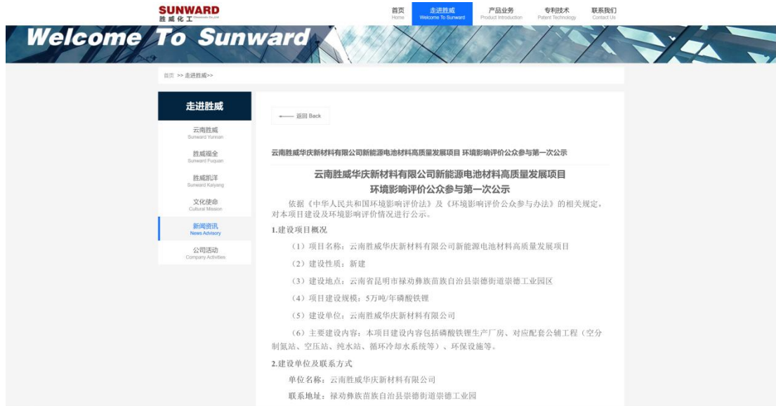
图 2-1 第一次公示照片