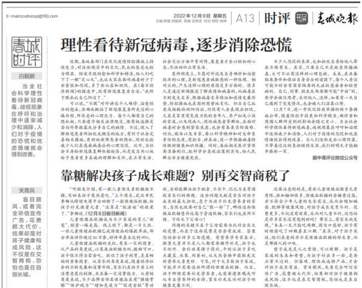
图 3-2 第一次报纸公示照片